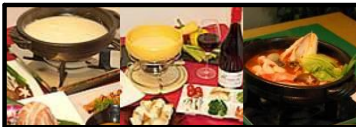
★豆乳鍋コース★ ★チーズフォンデュコース★ ★トマト鍋コース★ お一人様4,800円 お一人様5,000円 お一人様5,000円

新年会実施の一週間より前にご予約を頂きましたら、お年玉特典として各コースの価格から お一人様500円 の、ディスカウントをさせていただきます。皆様、新年会もハーベストでおしゃべりして、飲んで、食べましょう。お鍋以外のコースもごございますので、ご相談下さい。