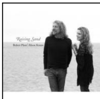
R. Plant & A. Krauss

今年も2月8日に授賞式が行なわれ、以前このコラムでもご紹介したRobert Plant & Alison Kraussのアルバムが、主要3部門のうち2部門を含む5部門(!)での受賞を達成しました。すごい!!